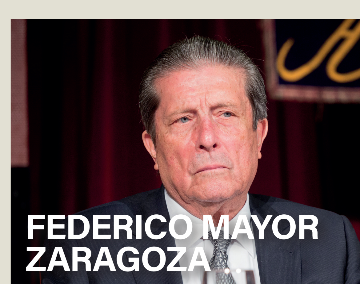
FEDERICO MAYOR ZARAGOZA